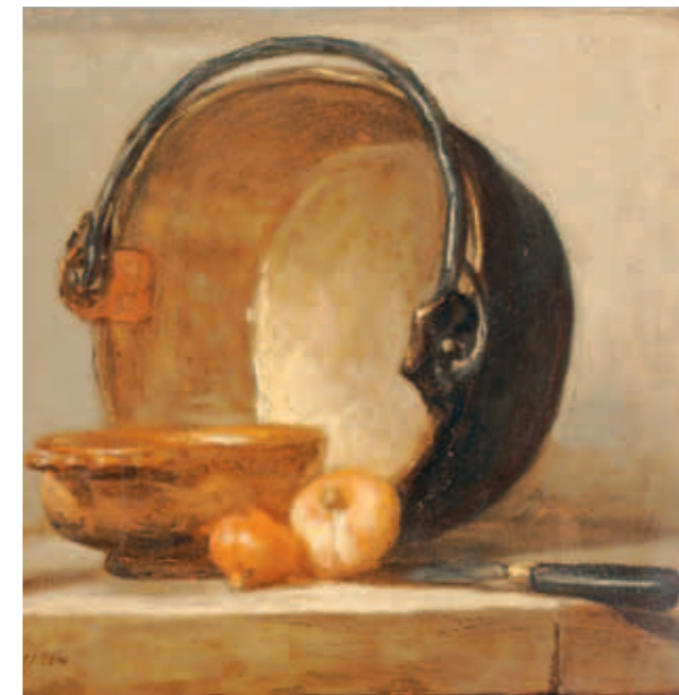
CI-CONTRE Nature morte au chaudron de cuivre, Jean-Baptiste Chardin