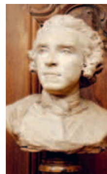
CI-DESSUS Buste du Maréchal de Saxe, Jean-Baptiste II Lemoyne © Jean-Marc Moser