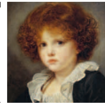
CI-DESSUS Petit garçon au gilet rouge, Jean-Baptiste Greuze, entre 1775 et 1780

Les visiteurs sont également invités à découvrir des facettes inédites du XVIII e siècle à travers des expositions temporaires installées dans les salles du rez-de-chaussée. Explorant l'œuvre d'un artiste, une production technique ou encore l'art de vivre au XVIII e siècle, les expositions proposent un renouvellement du regard porté sur la collection permanente.