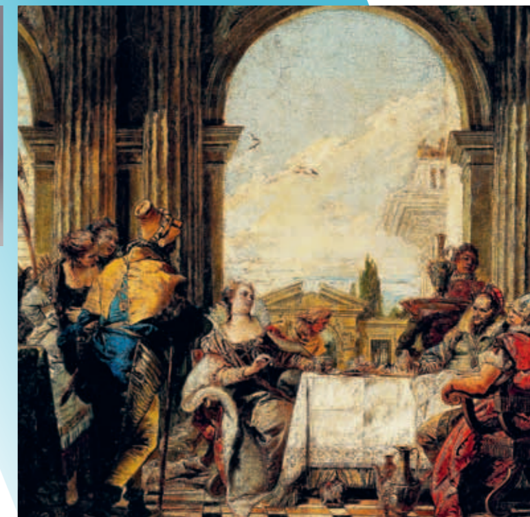
CI-CONTRE Le Banquet de Cléopâtre, Giambattista Tiepolo, entre 1742 et 1743